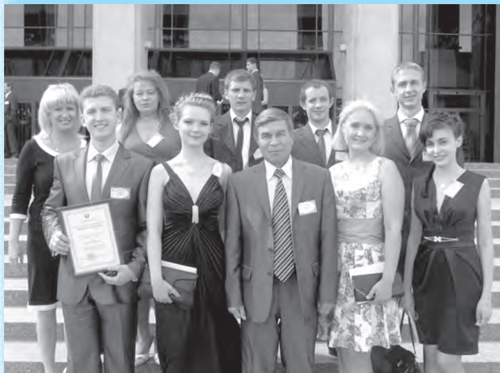
На бале ў Прэзідэнта