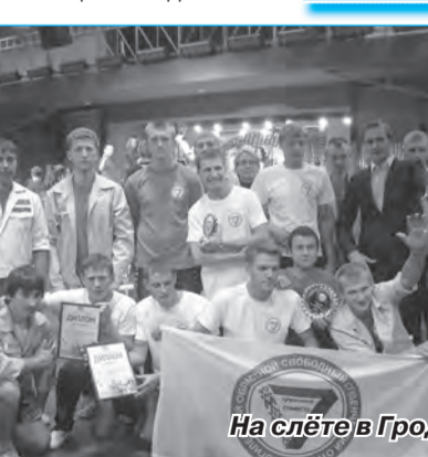
На слёте в Гродно.

Молодёжный центр углубляется вниз, под землю, на 2 этажа. Их занимают тренажёрный зал, зал для занятий настольным теннисом и другие специализированные помещения. Одним сло-