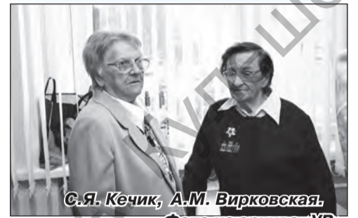
С.Я. Кечик, А.М. Вирковская.

1 октября – День пожилых людей – праздник чистый и светлый, праздник наших коллег, наших родителей, бабушек и дедушек, день, когда мы отдаем им свою любовь, уважение и признательность. Он отмечается в особое время года – золотой осенью. У каждого человека будет своя «золотая осень», сотканная из прожитых лет.