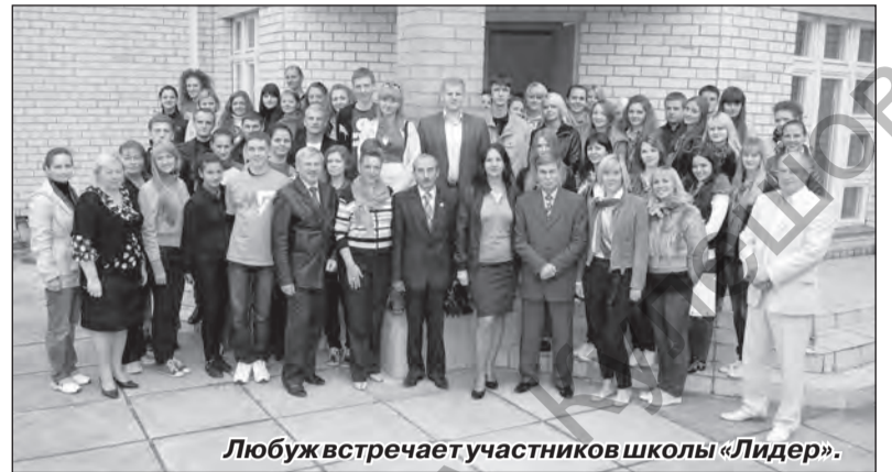
Любуж встречает участников школы «Лидер».