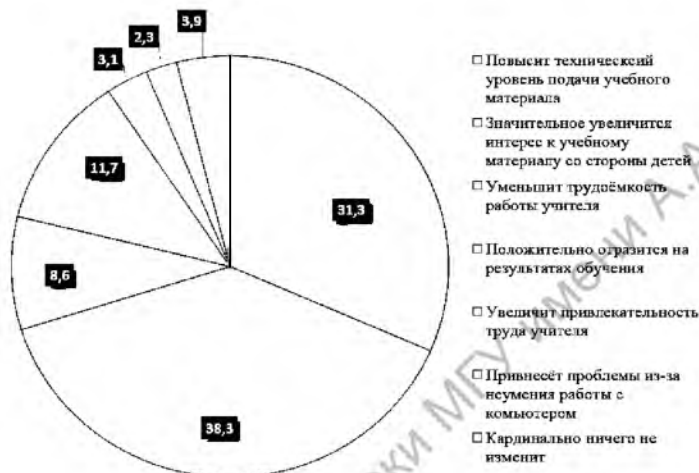
Рис. 2. Влияние ИКТ на учебный процесс

Из данных рисунка 1 можно видеть, что использование ИКТ в сфере высшего образования невероятно повышает запоминаемость, внимательность и экономит время, которое необходимо для изучения учебного материала. На рисунке 2 приведены сведения о влиянии ИКТ на образование в высшей школе.