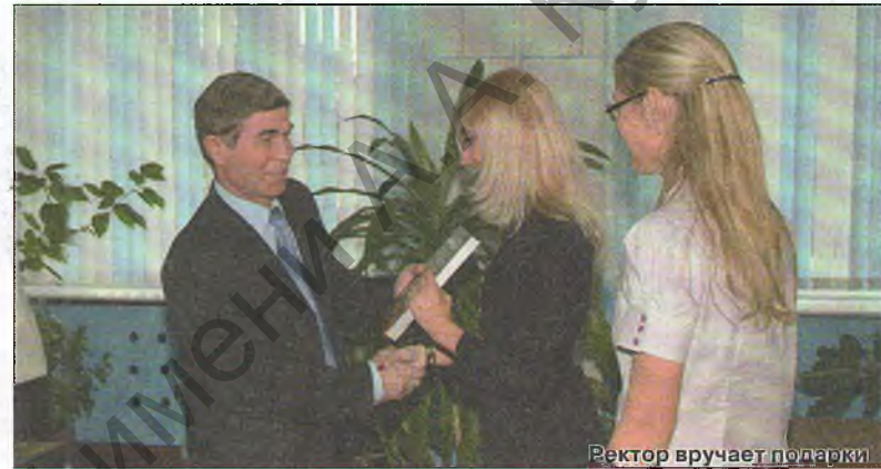
Ректор вручает подарки