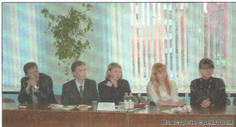
На встрече с ректором

данном факультете 75% платников? – Все премиальные фонды регламентируются, премии распределя-