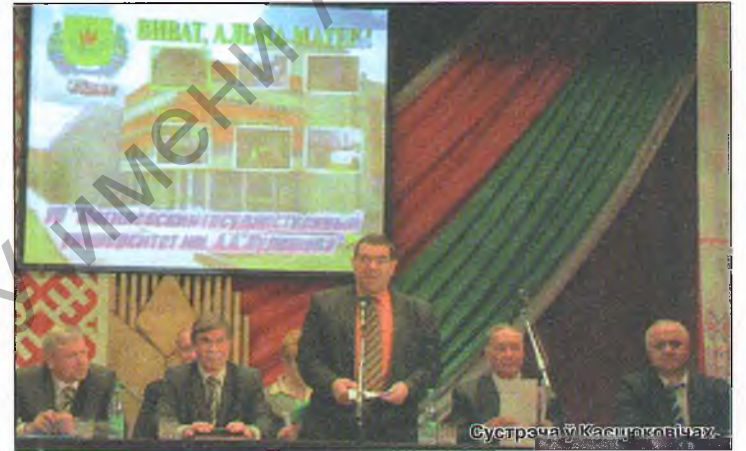
Сустрэча ў Касцюковічы.

Пры ўваходзе ў цэнтр культуры маладых касцюкоўцаў сустракала выстава падручнікаў і вучэбных дапаможнікаў, наладжаная ўніверсітэтам разам з супрацоўнікамі РЦК.