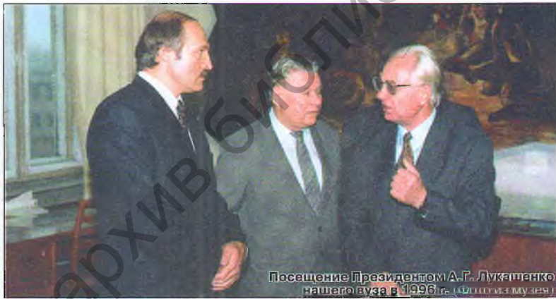
Посещение Президентом А.Г. Лукашенко нашего факультета в 1996 г. (слева от меня)