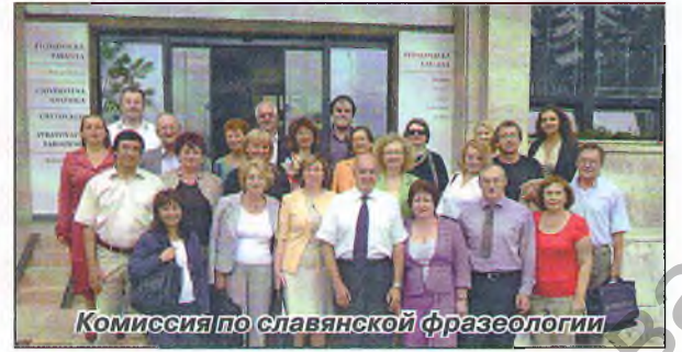
Комиссия по славянской фразеологии