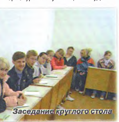
Заседание круглого стола

Вот так прошло знакомство первокурсников со студенческой жизнью. Первокурсники узнали, что студенче-