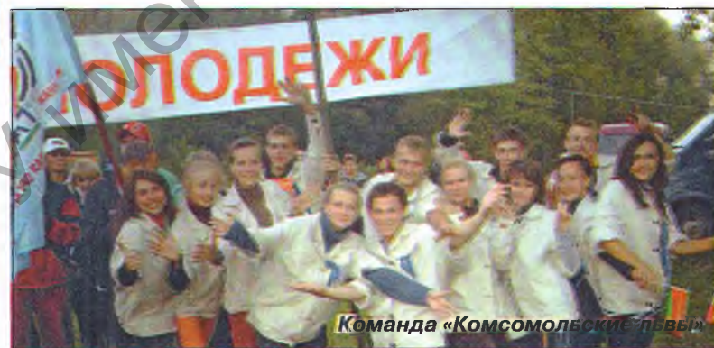
Команда «Комсомольские пловцы»

Накануне 90-летия комсомола Беларуси в Славгородском районе прошла спартакиада актива Могилёвской областной организации ОО «БРСМ». Проведение спартакиады актива стало уже традиционным, однако впервые на данном мероприятии была представлена команда нашего университета. Это 16 самых спортивных, талантливых и веселых активистов БРСМ.