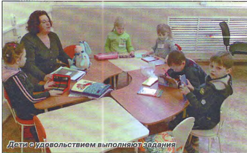
Дети с удовольствием выполняют задания

Занятия в Центре ведут как преподаватели университета, так педагоги-практики, психологи, учителя-предметники, имеющие большой опыт преподавания. Они всегда в курсе новейших образовательных тенденций, поэтому им легко наладить контакт с детьми и подростками, найти подход к каждому из них. В новом учебном году Образовательно-научный Центр расширит спектр занятий для различных возрастных групп.