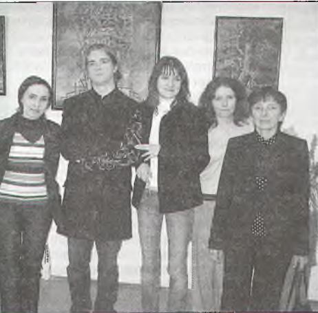
трируют народный академический вокальный ансамбль «Гармония» (руководитель В.П. Рева), народный