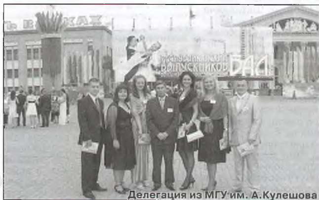
Делегация из МГУ им. А.Куляшова

Каждый год в Минске проводится выпускной, который отличается от всех просто потому, что он объединяет лучших из лучших, что проводится на Самом Высоком Уровне.