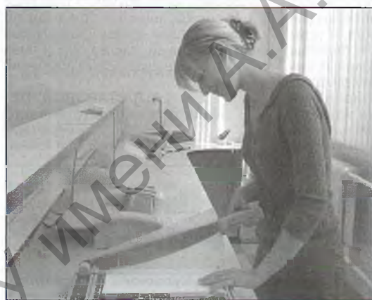
В печатном салоне «КосмоПринт»

28 августа в университете начал свою работу печатный салон. Его местонахождение – 1-ый этаж главного корпуса, рядом с книжным магазином «Мир знаний».