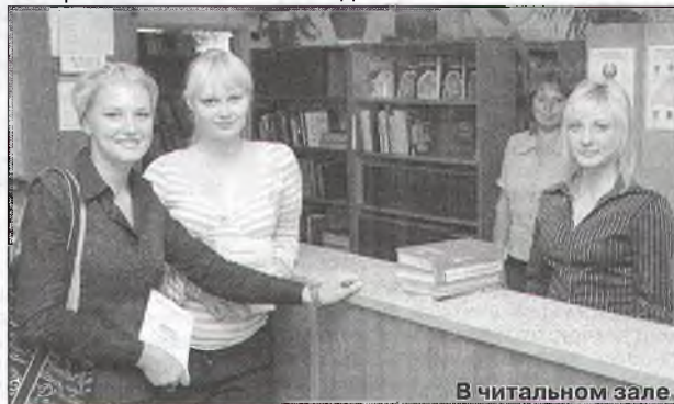
В читальном зале.

Вас познакомят с библиотекой и ее отделами, с библиотечным фондом и системой каталогов и картотек; научат алгоритму информационного поиска в электронном каталоге и базах данных.