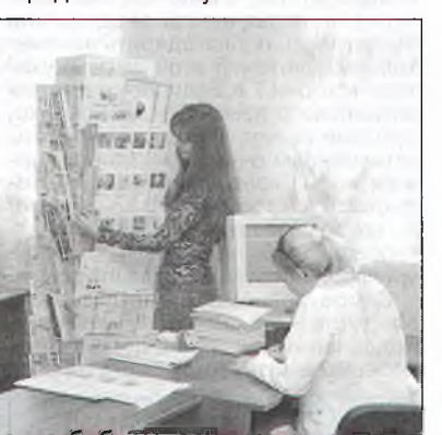
В справочно-библиографическом отделе.

Дорогие первокурсники! Поздравляем вас с Днем знаний и началом обучения в Могилевском государственном университете им. А.А. Кулешова! Двери в мир науки открылись перед вами. Надеемся, что вы в полной мере воспользуетесь теми широкими возможностями, которые предоставляет вузовская библиоте-