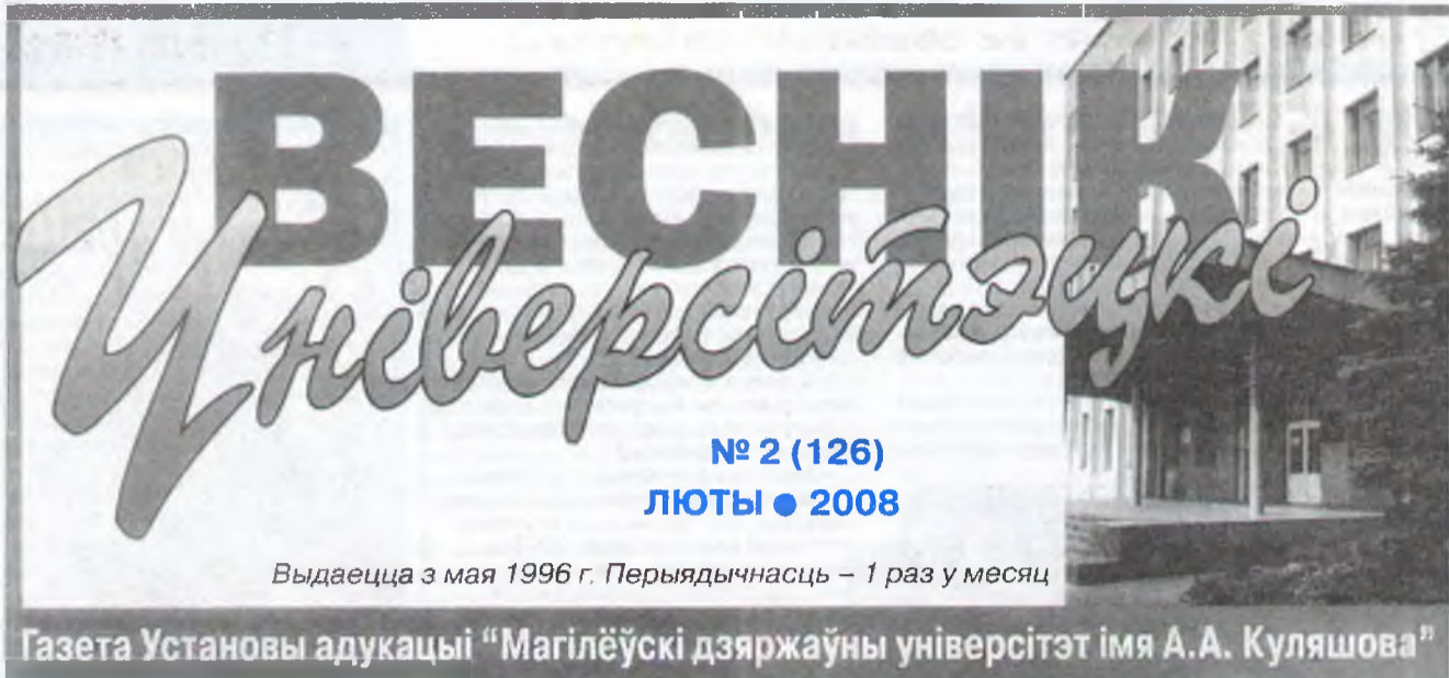
Выдаецца з мая 1996 г. Пэрыядычнасьць - 1 раз у месяц

В рамках проводимого мероприятия была организована выставка материалов по библиотерапии «... И книги лечат».