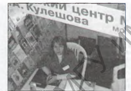
часопісам «Мішпоха», апаўднаннем Васіля Быкава «Бедныя людзі» ў перакладзе на іўрыт.