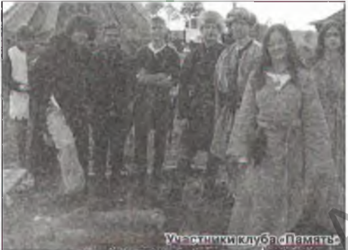
Участники клуба «Память»

Поиск – это всегда стремление к чему-то новому, неизведанному. Пожелаем ребятам удачи! Возможно, благодаря им, страниц военной истории г. Могилёва станет больше.