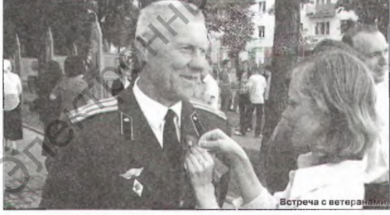
Встреча с ветеранами