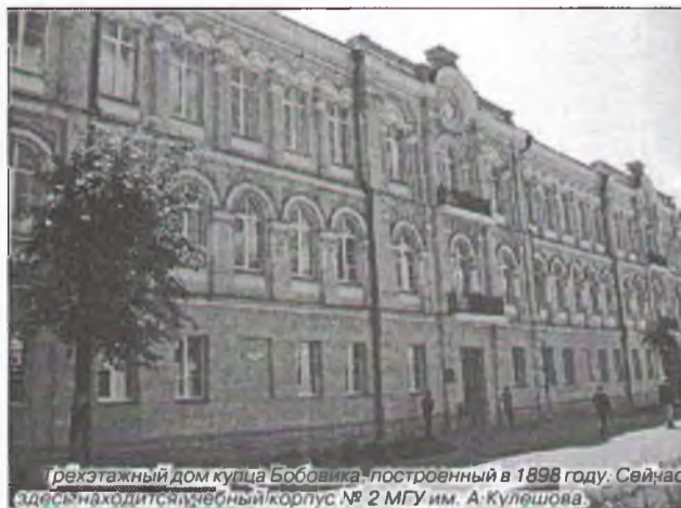
Ректатный дом купца Бобовика – построенный в 1898 году. Сейчас здесь находится учебный корпус № 2 МГУ им. А.Кулешова.

Условия, в которых жили, работали и учились в то время, были нелегкими. В годовом отчете института, помимо всего прочего, говорится: «Учебных помещений недостаточно, что не позволяет освободить кабинеты для самостоятельной работы студентов. Учебные помещения плохо отремонтированы и плохо отеплены. Значительная часть окон заложена кирпичом, поэтому световая площадь