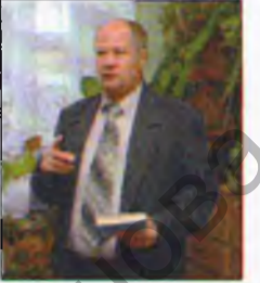
Працяг на 2-й стар.

— І-ы з'езд вучоных Рэспублікі Беларусь, які распачне сваю працу ў канцы кастрычніка гэтага года, несумненна, стане значнай падзеяй у культурным і навуковым жыцці нашай краіны. Думаецца, што пытанні, якія дзевяццацца разгледзець у час работы з'езда (абмеркаваць на пленарных і секцыйных пасяджэннях), будуць шматаспектнымі і актуальнымі. Не сумняваюся, што вучоным на з'ездзе атрымаюць адказаў на многія з гэтых пытанняў. Адно з іх — вызначэнне прыярытэтных навуковых кірункаў ва ўсіх галінах навукі. Гэта дазволіць пазбегнуць распрацоўкі дробных навуковых тэм ці тых, што на сённяшні дзень перасталі (або перастаюць) быць надзённымі.