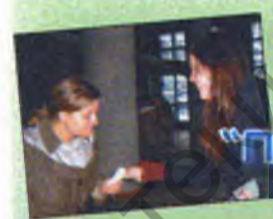
Мама, маці, матуля... Самае першае п'яшчотнае, ласкавае слова. Няма чалавека найважнейшага для кожнага з нас...