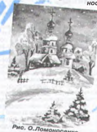
Рис. О. Ломоносовко.