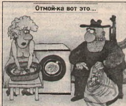
Отмой-ка вот это...