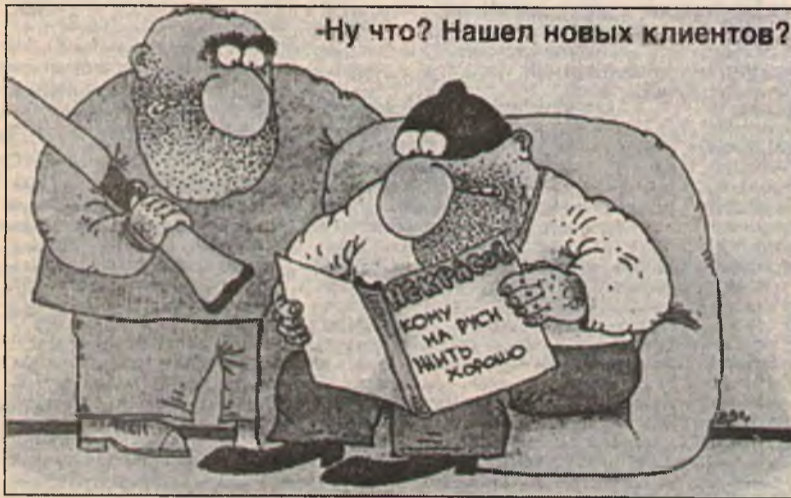
— Ну что? Нашел новых клиентов?