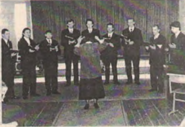
Выступает мужской хор "Кант" педагогического факультета.