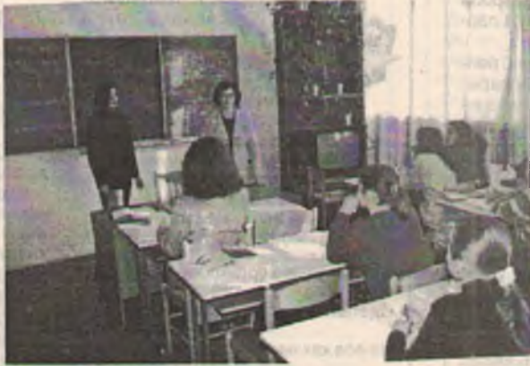
Практические занятия по русскому языку на филологическом факультете.