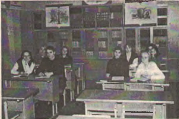
Самостоятельная работа в кабинете восточнославянской и российской истории.