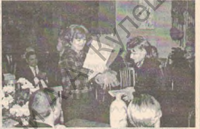
10-летний юбилей отметило литобъединение "Натхненне".