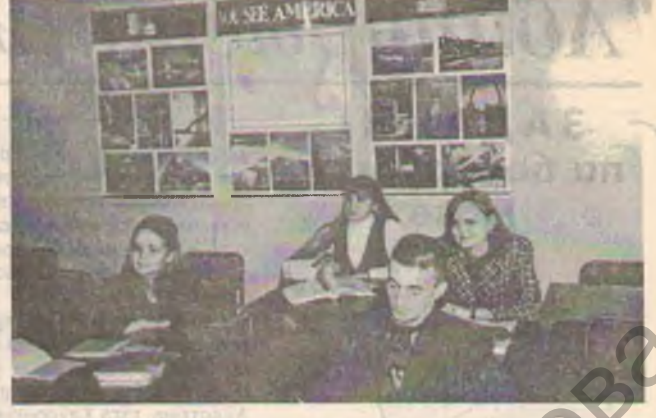
В кабинете английской филологии идут занятия.