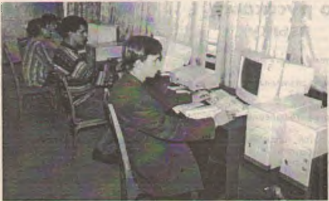
Студенты физмата приобретают навыки работы на современной технике.