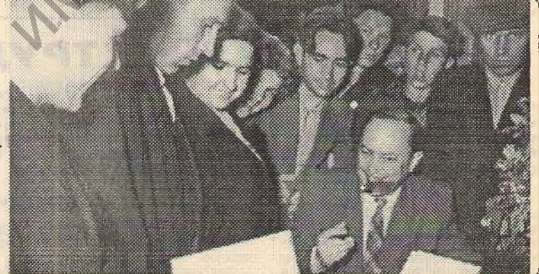
Сярод чытачоў. (Здымкі з архіва музея імя А. А. Куляшова).