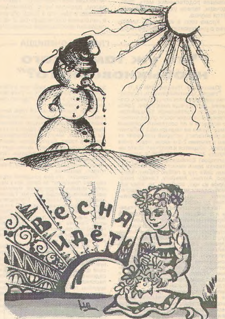
Рис. М. ДЕМИДЕНКО, студентки II курса педфака.