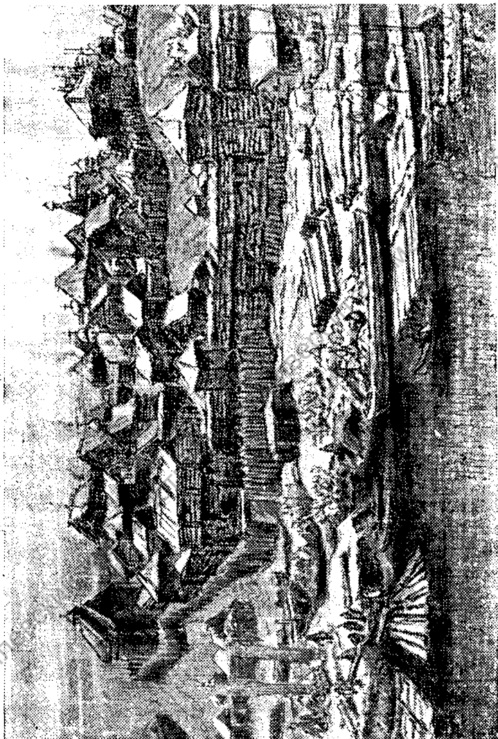
Московский Кремль в XIV веке. (С рисунка Ал. Васнецова.)