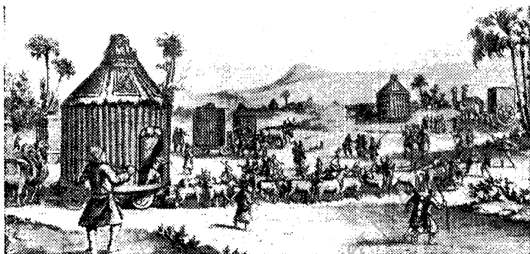
Монголо-татарские кибитки. (Из книги «История монголов» Плато Карпини.)

Татары подступили к ней со стенобитными машинами, осадными лестницами и целыми отрядами метателей огня.