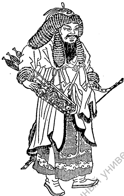
Чингис-хан. (С китайского портрета.)

кривых сабель, луков, стрел, секир и пик с крючьями для стаскивания с седел неприятельских всадников. Каждый воин имел при себе пилку для затачивания стрел (острия их, кроме того, закалялись в огне и затем заливались водой с солью), имел также иголки, нитки и сито для процеживания мутной воды.