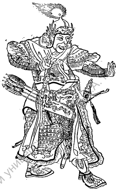
Субэцэ, полководец Чингис-хана. (С. китайского портрета.)