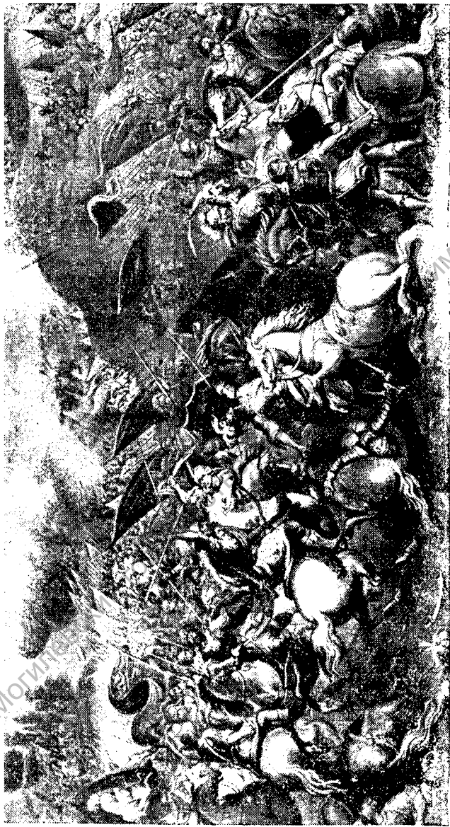
Куликовская битва. (С картины XVIII века, приписываемой художнику Матвееву.)