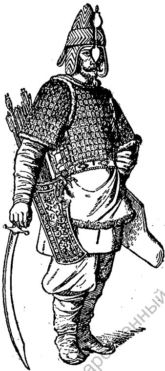
Тип русского воина. (1300—1500 годы.)

«Пусть поведают в дальних землях о том, что случится», сказал князь Дмитрий. Но сурожане, хорошо знавшие степь, были полезны и как проводники.