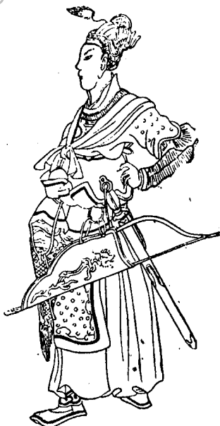
Батый. (С китайского портрета.)