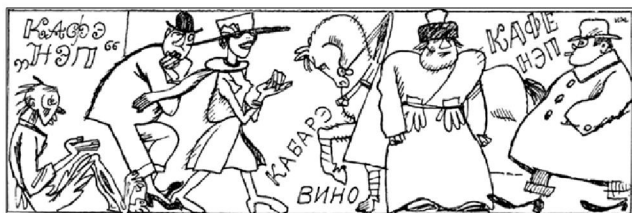
Рис. 2. «Жив курилка» (1922 г.). Автор рисунка – Ив. Малютин

А в году двадцать втором Вновь живут интеллигенты Веселее с каждым днем И в карман кладут проценты Снова их настали дни: Лихачи у входа ждут их, И катаются они В милый «Яр» на шинах дурых!..