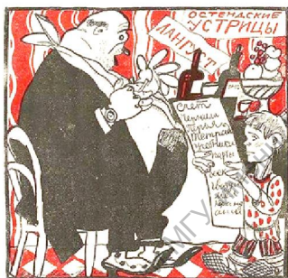
Рис. 3. Карикатура «Счет» из журнала «Крокодил» (1923 г.)

Наиболее ярко перечисленные критерии были выражены в карикатуре Ив. Милютина «Счет» (1923 г.) [2, с. 16], где была изображена та самая дифференциация населения. Автор говорит о том, что нэпман был с родни богатому капиталисту, а значит и повадки к роскоши у них были одинаковые. При этом нельзя сказать аналогичное про образ «народа», который был показан в виде голодающего и мало обеспеченного «школьника».