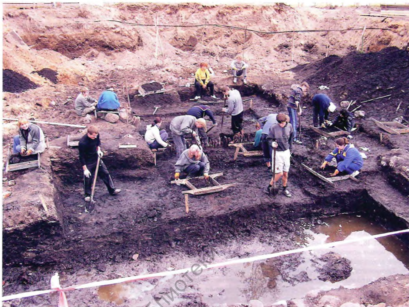
Выратавальныя раскопкі на Вялікім пасадзе Полацка. 2005 г.