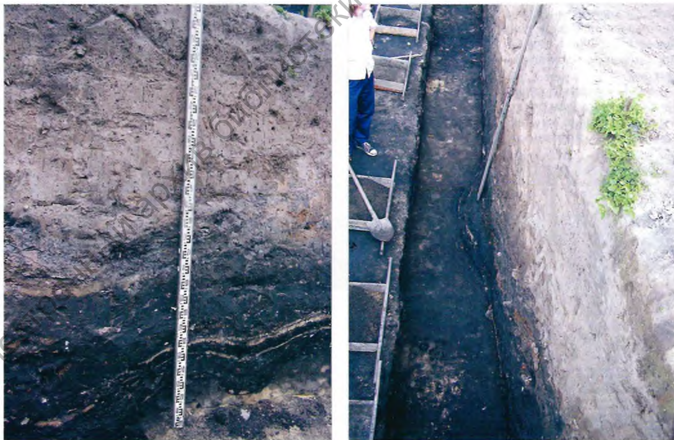
Полацкае гарадзішча. Пласт пажарышча (унізе), з якога атрымана радыёвугляроднае датаванне і ў якое знойдзена ляпная кераміка канца VIII ст. 2007 г.

Не менш важкім дзякуючы археалагічным раскопкам стала вызначэнне задумы Еўфрасінні па пачатковым выглядзе Спасакай царквы XII ст. Адкрытыя