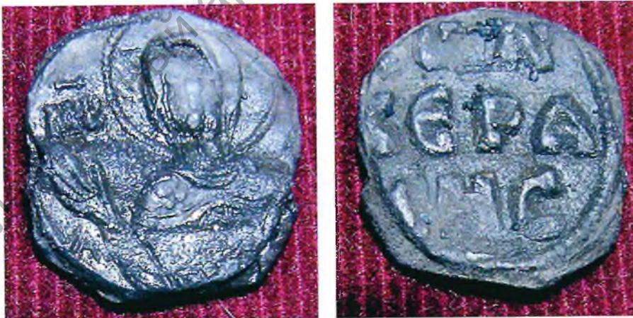
Свінцовая віслая пячатка вікарыя Канстанціна з горада Керамаса, епархія горада Афрадзісіаса (з раскопак полацкага Вялікага пасада 2005 г.). Візантыя, XII ст.

Адзначым яшчэ адну важную акалічнасць. Многія са згаданых археалагічных адкрыццяў зрабіліся магчымымі дзякуючы сацыяльна-эканамічным праектам, ініцыятарам якіх выступаюць інстытуты дзяржаўнай улады і іх кіраўнікі. Згаданы прыклад прамога даручэння Намесніка Прэм’ер-міністра па рэканструкцыі Спаса-Праабражэнскай царквы ў 2015 г. не адзінкавы. Так, ініцыятыву полацкіх уладаў па рэканструкцыі Верхняга замка ў 2018 г. актыўна падтрымаў на той час кіраўнік Міністэрства адукацыі і колішні выпускнік СШ № 14 г. Полацка І.В.Карпенка. Дзякуючы яго ўдзелу быў распрацаваны праект прыстасавання будынкаў Верхняга замка пад патрэбы кадэцкага корпуса, і неўзабаве пачаліся маштабныя працы па іх рэканструкцыі і будаўніцтве новых аб’ектаў інфраструктуры.