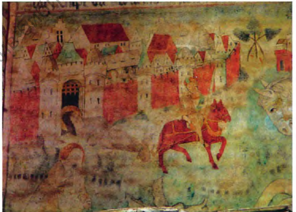
Фрагмент фрэскі з бернардзінскага касцёла ў Вільнюсе з выявай Запалоцкага пасада ў Полацку і бернардзінскага кляштара (будынка за брамай). Першая палова XVI ст.

Рэзкае павелічэнне плошчы Полацка ў XI ст. адбываецца за кошт разгалінавай сеткі пасадаў. Найбольш цікавыя археалагічныя адкрыцці былі зроблены намі на Запалоцкім пасадзе. У XI ст. на гэтым месцы пражывалі баяры, прадстаўнікі княжацкай адміністрацыі [17]. Верагодна, што менавіта тут пасля забойства Рагвалода мог размяшчацца двор намесніка Уладзіміра Святаслава [18]. Аднак раскопкі на Запалоцкім пасадзе дазволілі прыадчыніць яшчэ адну таямніцу, звязаную з жыццём у Полацку нашага славутага земляка, першадрукара Францыска Скарыны. Археалагічныя сведчанні пачатковай вучэльні Скарыны ў Полацку знойдзеныя намі пад час археалагічных раскопак у 2010—2011 гг. [19]. Былі выяўлены драўляныя рэшткі пабудовы бернардзінскага кляштара 1498—1563 гг. з разваламі печай і комплексам розных рэчаў. І хаця Полацк не стаў месцам выдання Скарынам першых кніг Бібліі, ён стаў месцам нараджэння, пачатковага навучання і крыніцай творчага натхнення славутага палачаніна.