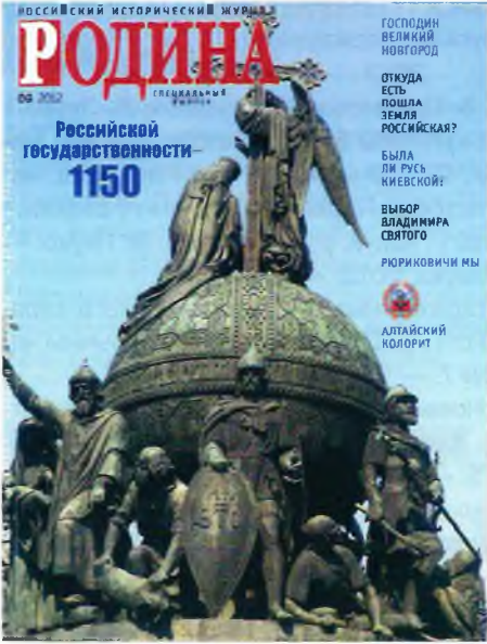
Расійскі гістарычны часопіс "Родина". 2012, № 9.