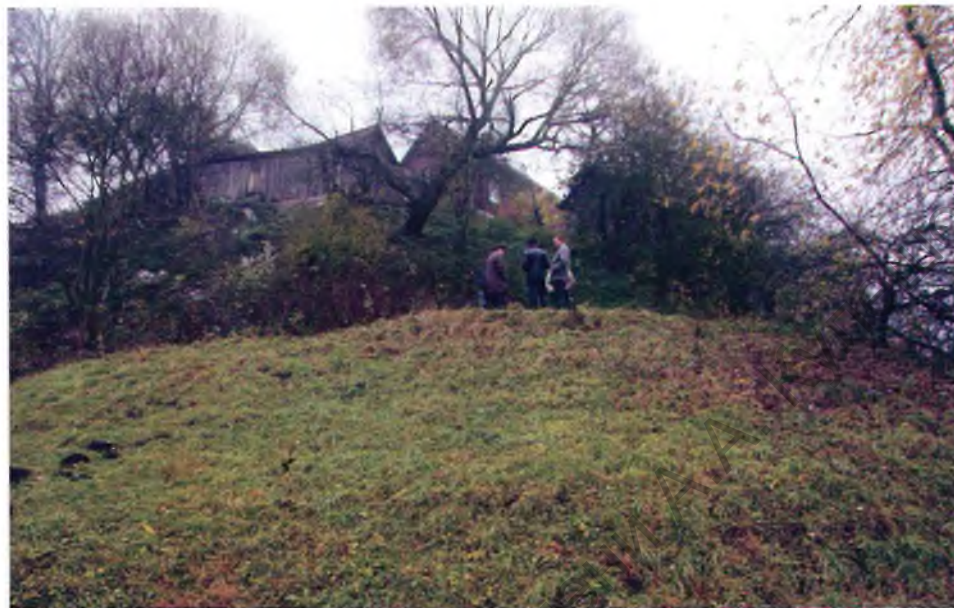
Выгляд полацкага гарадзішча з паўночнага боку. 2007 г.

У 2012 г. на базе Полацкага дзяржаўнага ўніверсітэта была праведзена маштабная навуковая канферэнцыя,