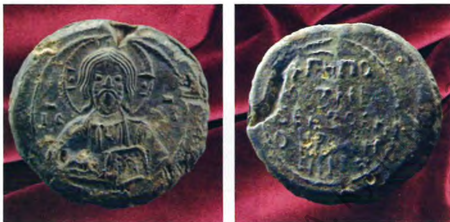
Пячатка Еўфрасінні Полацкай, знойдзеная ў часе археалагічных даследаванняў Спаса-Праабражэнскай царквы ў 2015 г.

У 2015 г. па хадайніцтве кіраўніцтва Спаса-Еўфрасіннеўскага жаночага манастыра і па даручэнні Намесніка Прэм'ер-міністра Рэспублікі Беларусь Н.І.Качанавай у Полацку пачынаецца комплексная рэстаўрацыя Спаса-Праабражэнскай царквы. Дагэтуль пытанні рэстаўрацыі адзінага полацкай школы доўгавядучага помніка XII ст. не вырашалася на працягу многіх гадоў. Гэтыя работы прадугледжвалі распрацоўку дэталёвага праекта, дзеля чаго неабходна было правесці археалагічныя даследаванні. У выніку дзейнасці сумеснай экспедыцыі Полацкага дзяржаўнага ўніверсітэта (Рэспубліка Беларусь) і Дзяржаўнага Эрмітажа (Расійская Федэрацыя) былі зроблены важныя археалагічныя знаходкі. Сярод іх — адкрыццё дзвюх пячатак Еўфрасінні Полацкай, асабістай як духоўнай