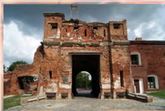
Внешний фасад Тереспольских ворот Брестской крепости