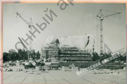
Главный монумент в строительных лесах. 1971 г.

Первый камень в основание Брестской крепости заложили ещё во времена Российской империи, в 1836 году.