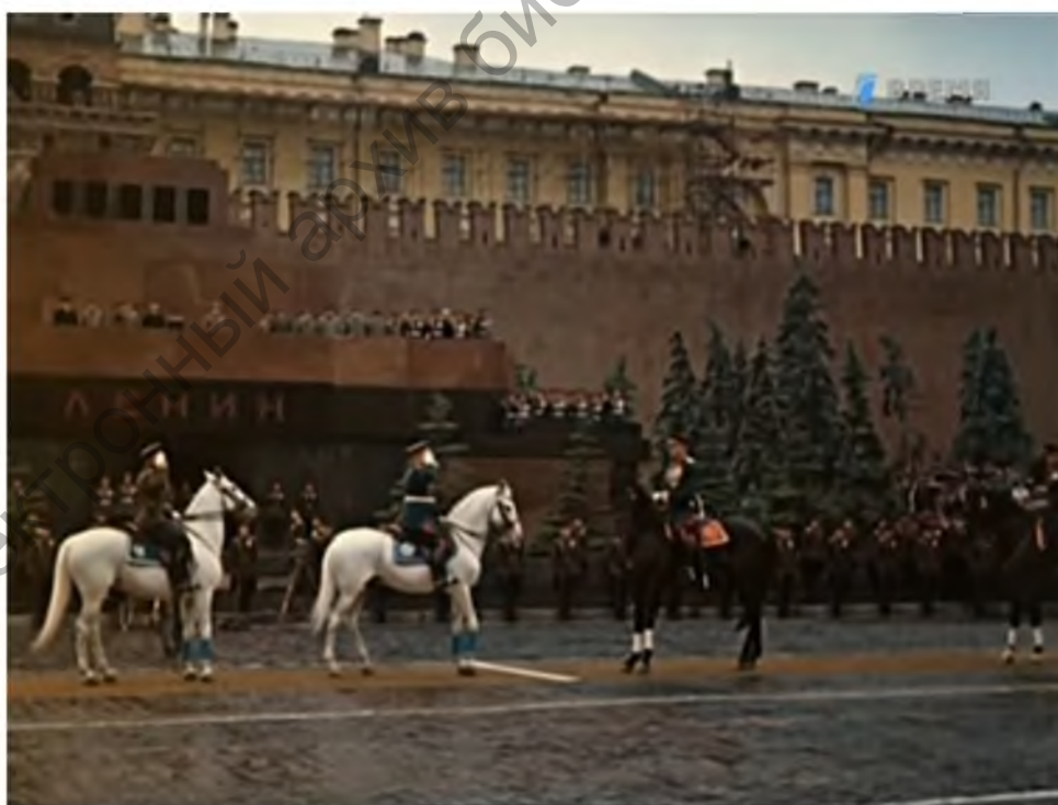
Парад Победы 1945 год