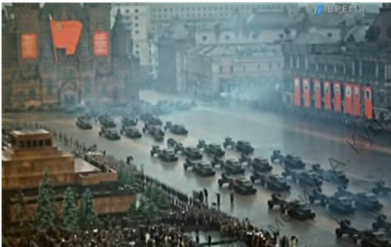
Смотр боевой техники, Парад Победы 1945 год

Никогда не забывали в нашей стране и о ветеранах. Для них устраивают концерты, организуют праздничные чаепития, ветеранам посвящают стихотворения о войне. В честь Дня Победы в средствах массовой информации появляются фото с ветеранами, а дети рисуют для них картинки, посвященные войне и празднованию Дня Победы.