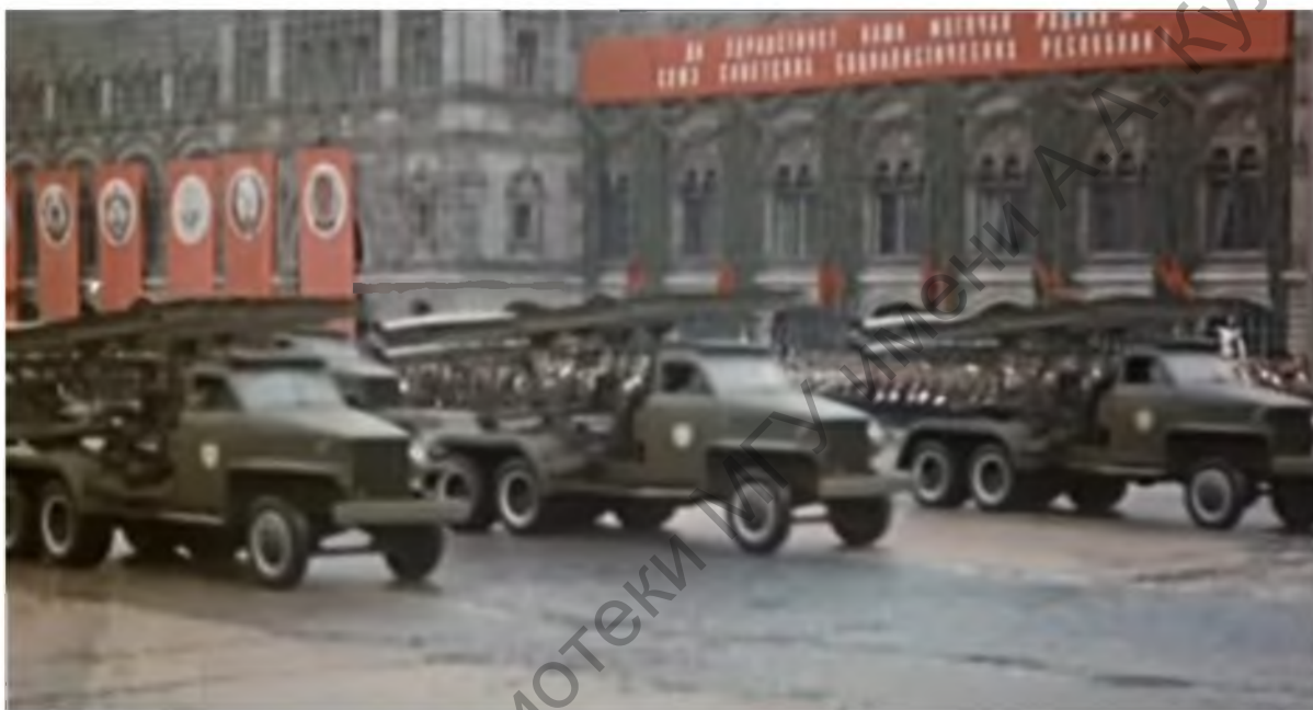
БМ-13 «Катюша», Парад Победы 1945 год

Однако парады на 9 мая проводились не всегда. После учреждения выходного дня и проведения парада 9 мая в 1965 году следующий прошел на Красной площади только в 1985 году. Этот год тоже был юбилейной датой Великой Победы. А вот после него очередной парад состоялся в 1990, затем в 1995 годах. Между ними День Победы отмечали другими мероприятиями, но без парадного прохода войск.