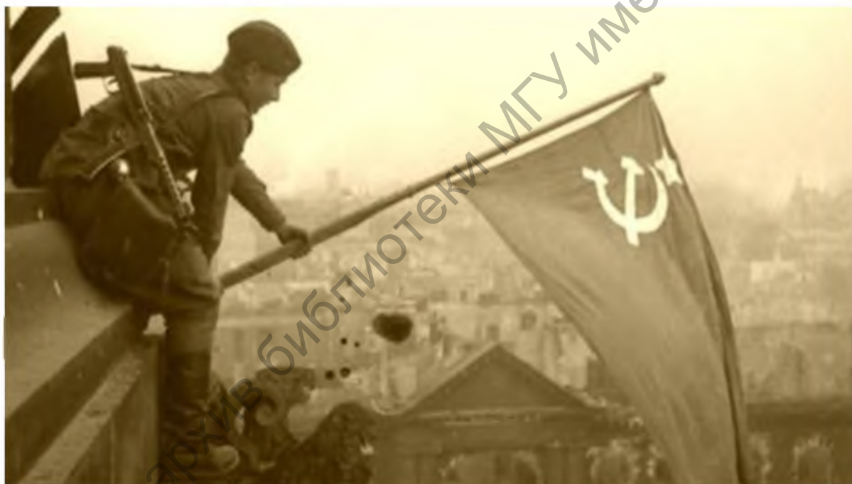
Установка флага на крышу Рейхстага

Празднование Дня Победы назначено в этот майский день не просто так. Именно 9 мая 1945 года немецко-фашистские войска полностью капитулировали.