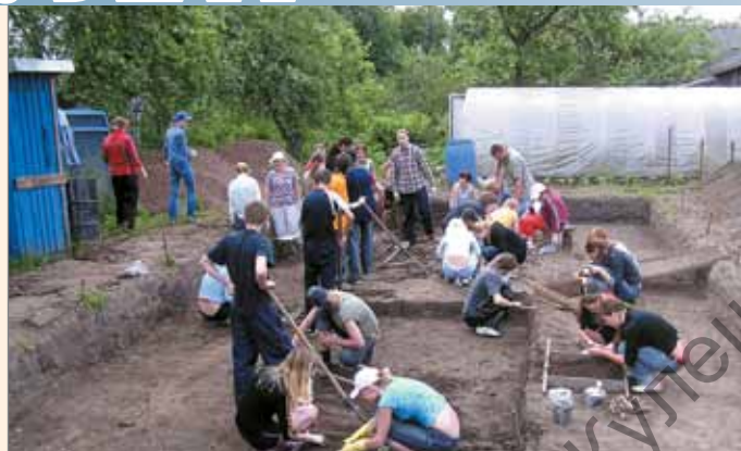
Раскопки на полоцком городище. 2007 г.

Новая концепция места и роли Полоцка в ранней древнерусской истории