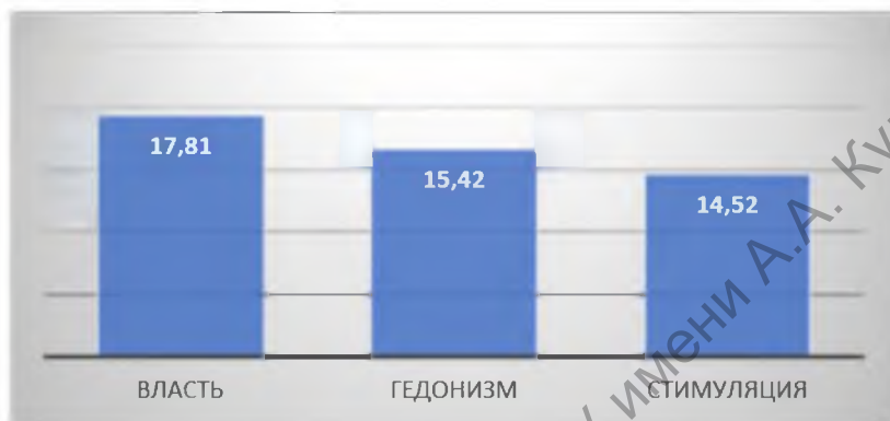
Рисунок 2 Рейтинг наименее значимых для студентов жизненных ценностей

Как следует из диаграммы, наименее значимыми ценностями для респондентов являются: стимуляция (средний показатель – 14,52), гедонизм (средний показатель – 15,42) и власть (средний показатель – 17,81). Такие результаты свидетельствуют о том, что у молодых людей недостаточно развито стремление к разнообразию переживаний для поддержания оптимального уровня активности и потребность в чувственном удовольствии и наслаждении жизнью (ценности западного общества). В тоже время для студентов являются недостаточно значимыми такие потребности, как достижение социального статуса, контроль над другими людьми и материальными ресурсами (ценности традиционного общества).