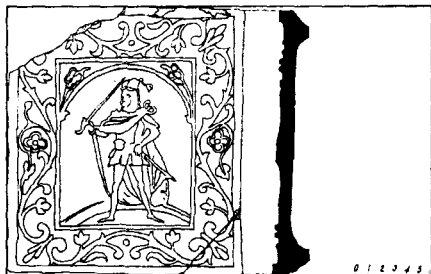
Мал. 4. Магілёўская кафля з выявай воіна. Сярэдзіна XVII ст.

Мастак рабіў акцэнт на раслінна-архітэктурным аздабленні, ён наўмысна «разбаўляе» сухія геаметрычныя формы стылізаванымі раслінамі ў вазе. Атрымалася зусім незвычайная карціна — рэалістычная выява воіна пад яркай, якая ў залежнасці ад фантазіі гледача можа падацца брамай батанічнага сада ці каланадай палацавага комплексу. Постаць воіна і размеркаванне вайскавай амуніцыі паказана так, што ствараецца ўражанне аб гатоўнасці мушкецёра ў любы час пачаць весці агонь.