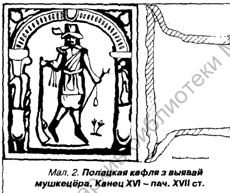
Мал. 2. Полацкая кафля з выявай мушкетёра. Канец XVI – пач. XVII ст.

Вялікую цікавасць у гэтым плане прадстаўляе полацкая кафля з выявай мушкетёра. Большасць пласцін захавалася фрагментарна [7], адна кафля цэлая [8]. З вонкавага боку кафля пакрыта зялёнай палівай, толькі адзін кавалак паліхромны [9]. У абодвух выпадках паліва нанесена на чарапок пасля абпалу, керамічнае цеста якаснае, светла-чырвонага колеру. Зялёная паліва, зробленая на свінцовай аснове з дабаўленнем фарбавальніка-вокіса медзі, у адным выпадку наносілася адразу на добра высушаную і адфармаваную паверхню — праз яе выразна праступае гліна самога чарапка, у другім прымянялася папярэдняе ангабіраванне. Уся мураўлёная кафля знойдзена падчас назіранняў за будаўнічай траншэяй на Верхнім Замку каля інфекцыйнай бальніцы [10], паліхромная пласціна паходзіць з Вялікага пасаду (раскопкі С.Тарасава ў 1988 г.).