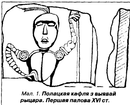
Мал. 1. Полацкая кафля з выявай рыцара. Першая палова XVI ст.

Трэцяя чвэрць XVI ст. была не вельмі спрыяльным часам для развіцця рамесніцтва ўсходняга рэгіёна ў выніку наступстваў Лівонскай вайны. Таму імклівае развіццё выяўленчага мастацтва кафлі звязана з апошняй чвэрцю XVI ст. Арнаментальныя матывы на рэчах канца XVI — пач. XVII стст. маюць прыкметы, характэрныя для рубяжа эпох. Выразнае аздабленне стыля барока накладаецца на рэнесансныя матывы, зводзячы апошнія да схематызму альбо пераўтвараючы іх у маньерыстычнай традыцыі.