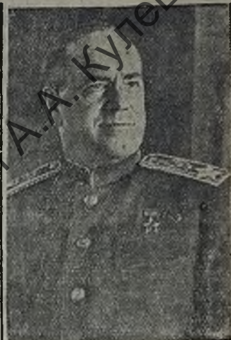
Маршал Советского Союза Г. К. ЖУКОВ.