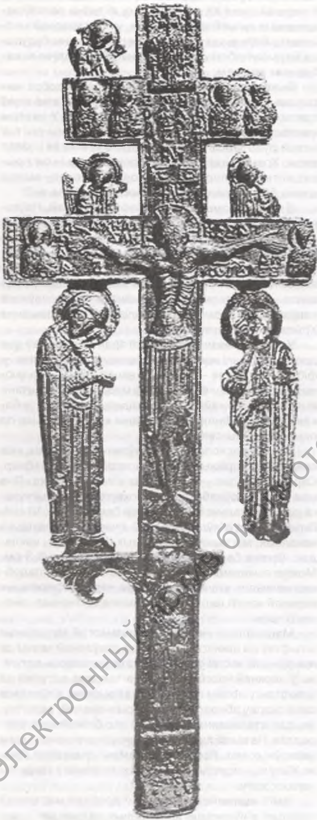
Кі votны крыж з Севастопаля (Херсанеса).

адлітыя бронзавыя фігуркі Багародзіцы і апостала Іаана, якія аплакваюць Хрыста (сюжэт распяцця на крыжы). Фігуркі адлітыя ў форме, малюнак барэльефны, вышыня адліўкі 0,4—0,6 см. Вышыня фігуркі Багародзіцы — 8 см. У фігуркі апостала адсутнічае галава, але захавалася ніжняя частка (мацаванне), што ўсё разам мае вышыню 8 см. Абедрзве фігуркі размяшчаліся на кі votным крыжы. Аснова кі votнага крыжа з цалкам аналагічнай фігуркай Прадстаячай Багамацеры была знойдзена ў 1940 г. у Севастопалі (Херсанесе). Асобная фігурка Іаана была знойдзена на Шапятоўскім гарадзішчы ў Хмяльніцкай вобласці (Украіна), яна датуецца першай паловай XIII ст. 35 . Дзве фігуркі, выяўленыя на полацкім гарадзішчы, — трэцяя знаходка ў гэтым шэрагу і мае вялікую археалагічную каштоўнасць. Як лічыць вядомы расійскі даследчык В.Г.Луцко, кі votны крыж быў адліты ў Кіеве візантыйскім майстрам. Аднак, на нашу думку, не выключана мясцовая (полацкая) адліўка абедзвюх фігурак. На карысць гэтага гавораць шматлікія абломкі тыглярэ, знойдзеныя ў стратыграфічным пласце XII—XIII стст.