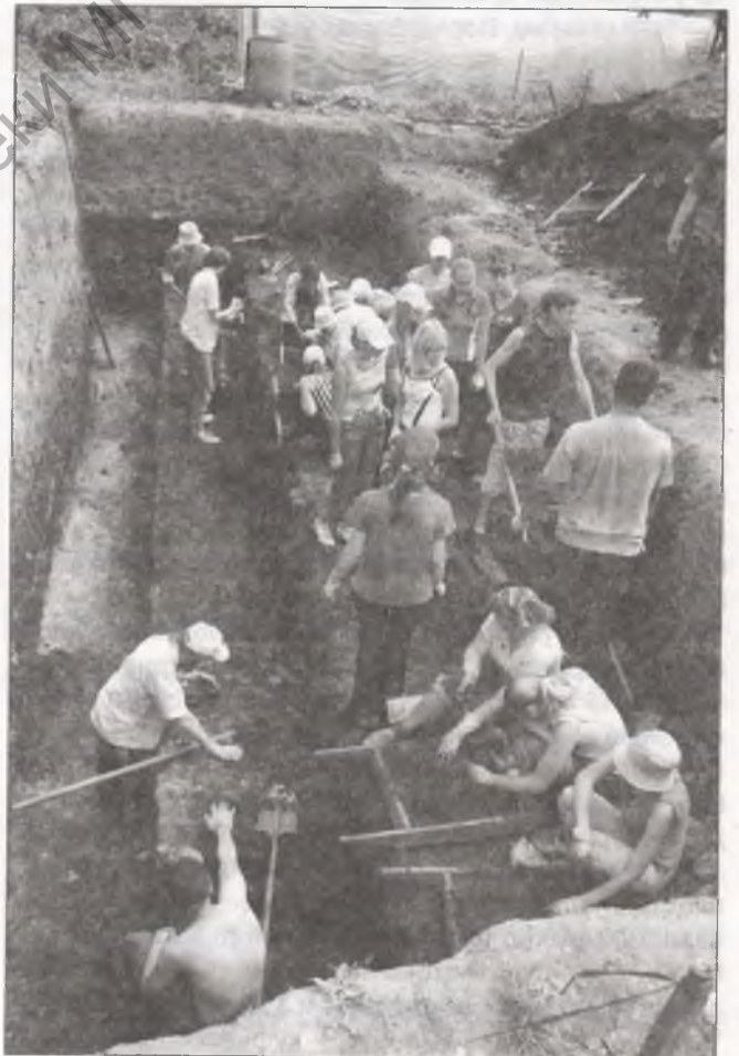
Падчас раскопак у 2007 г.