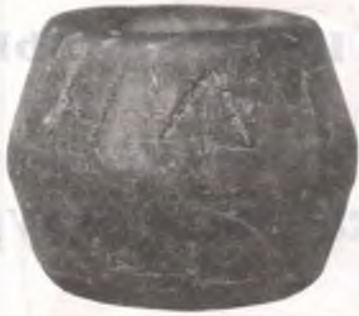
Прасліца з кірылічным надпісам.