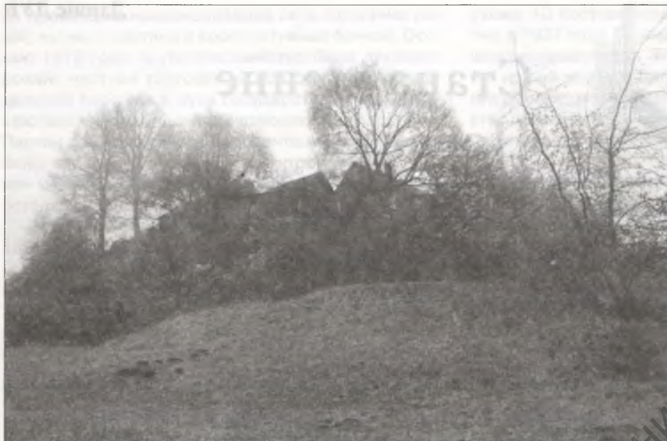
Від полацкага гарадзішча з паўночнага боку. 2007 г.

ўсходнім баку 7 . З 1947 г. гарадзішча шчыльна забудовалася, што цяпер перашкаджае правядзенню археалагічных даследаванняў на гэтым цікавым гістарычным помніку.