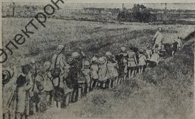
Ребята детского сада Володарского района приветствуют танк, идущий на фронт.