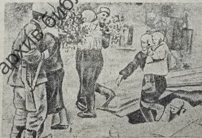
На снимке: жители села, прятавшиеся от немцев в подвалах, радостно встречают красноармейцев — своих освободителей.

освобождения, первая ночь без немецких людоедов.