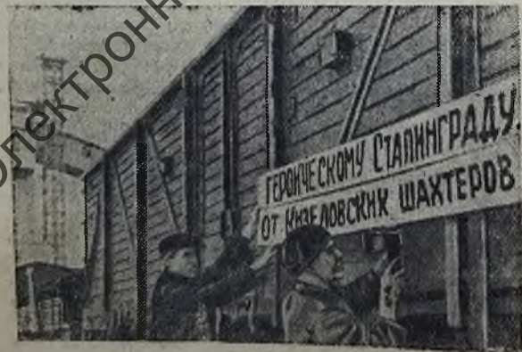
На снимке: сверхплановый эшелон угля — подарок сталинградцам.

Перевыполняя государственный план добычи угля, шахтеры дали в особый фонд Главного Командования из сверхплановой продукции три эшелона угля, а четвертый эшелон послали в подарок героическому Сталинграду.