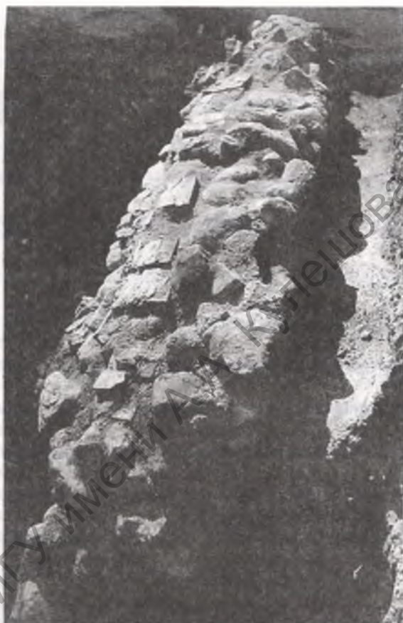
Паўночная сцяна мураванага церама. Раскопкі П.А.Рапапорта. 1977 г.

На тэрыторыі Верхняга замка не знойдзена слядоў рамеснай вытворчасці. Культурныя напласта-