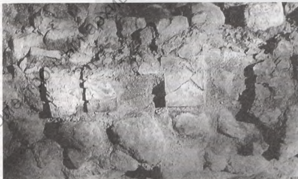
Ніжні рад цэглы на падмурку паўночнай сцяны церама. Раскопкі П.А.Рапапорта. 1977 г.

Абарончая функцыя была адной з галоўных функцый дзяцінца. Сляды магутных абарончых умаца-