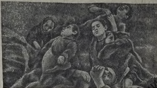
На снимке: группы мирных жителей, расстрелянных немцами в деревне 1-я Александровка, Орловской области.