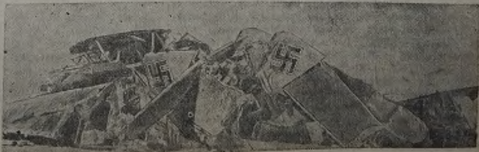
«Хейнкель-111», сбитый нашим истребителем.