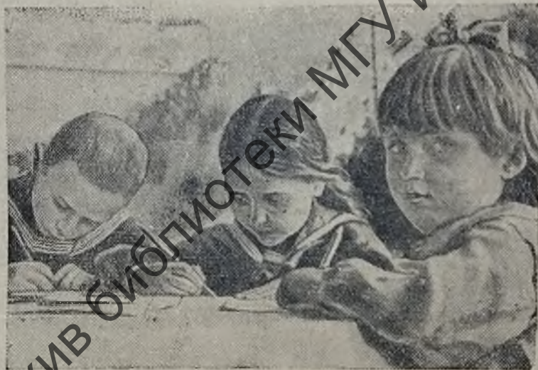
Заботой и вниманием окружены здесь дети, родители которых погибли от руки немецко-фашистских варваров.