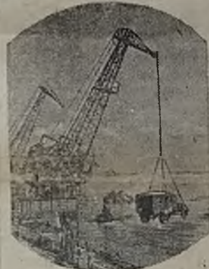
В Горьковском речном порту идет погрузка автомобилей для отправки в Сталинград.

В освобожденную от немцев Калининскую область начали поступать скот, эвакуированный в свое время в Ярославскую, Куйбышевскую и Вологодскую области.