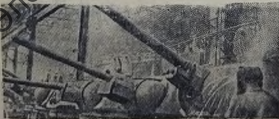
Монтаж и сборка артиллерийских частей.