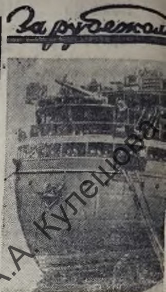
На снимке: прибытие парохода с подкреплением для американской армии.

В случае призыва члена хозяйства в Действующую Армию, дела о взысканиях недоимок по обязательным поставкам, по сельскохозяйственному налогу и другим налогам, падающим на хозяйство, а также по обязательному окладному страхованию, подлежат приостановлению, если в хозяйстве не осталось трудоспособных или если единственным трудоспособным, занятым в хозяйстве, является мать призванного или его жена с детьми до 7 лет. Дела о взыскании недоимок по налогам, падающим лично на гражданина, призванного в Действующую Армию (подходный налог, налог на одиночку и бездетных граждан, военный налог) подлежат приостановлению независимо от количества трудоспособных в хозяйстве призванного. Управление по государственному и бытовому устройству семей военнослужащих при Совнаркоме РСФСР.