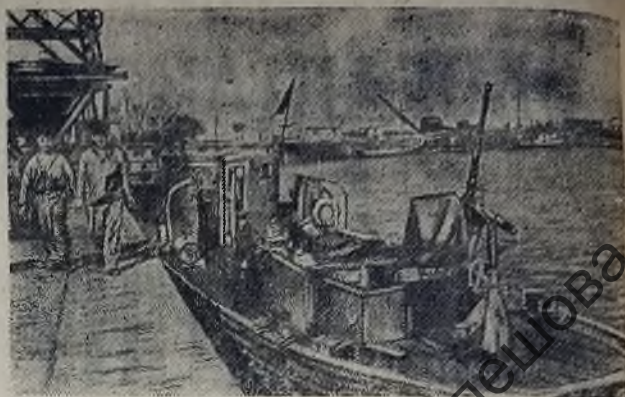
В Таганрогском порту