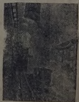
Выдача кокса на новой батарее (Кузнецкий металлургический завод им. Сталина)