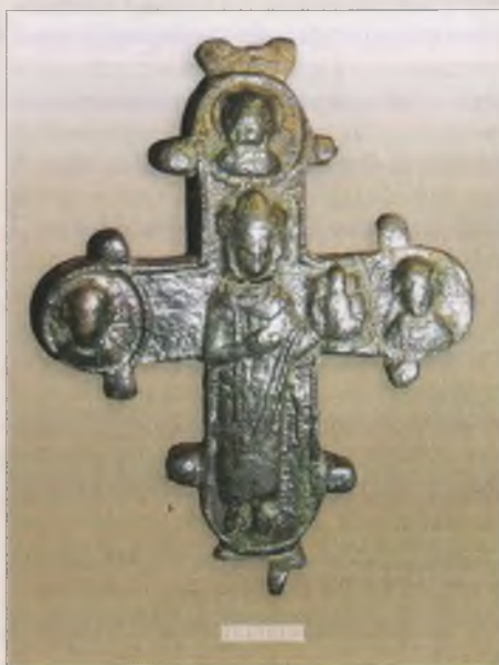
Медный крест-энколпион XII в. с изображением князя Глеба. Литьё, оборотная сторона.