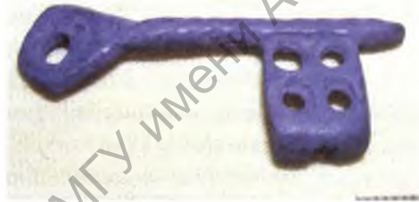
Мал. 12. Бронзавы ключык.