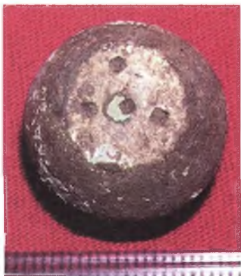
Мал. 15. Бронзавая гірка-разнавага.