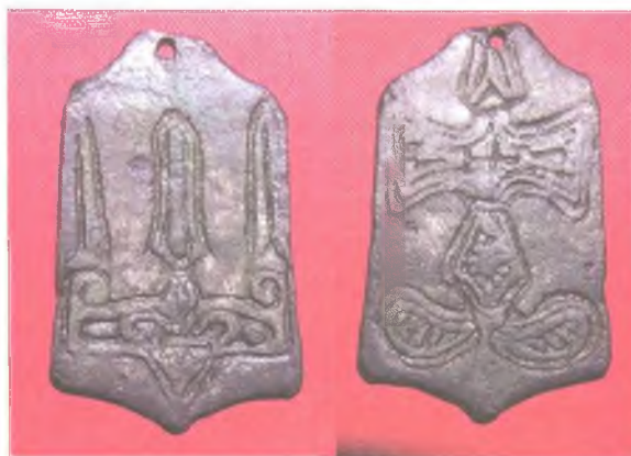
Мал. 5. Бронзавая падвеска з выявай княжацкага знака (пярэдні бок) і праквітнеўшага крыжа (адварот).