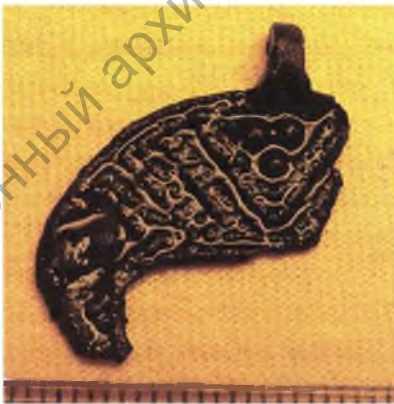
Мал. 13. Бронзавая падвеска.