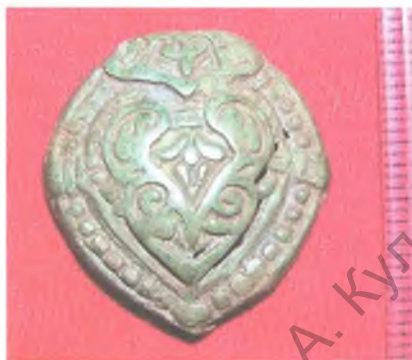
Мал. 6. Бронзавая накладка на скураны рамень.

кай адміністрацыі для адлюстравання свайго статусу, г.зн. былі свайго роду даверчымі знакамі. Дакладны аналаг дадзенай падвескі знойдзены на Перадольскім пагосце (пад'ёмны матэрыял, захавалася ніжняя частка) [3, рис. 15: 2]. С.В. Бялецкі суадносіць падвеску з князем Уладзімірам Святаславічам (параднае адлюстраванне родавага знака Уладзіміра Святога), а час яе вырабу звязвае з 988 г. [3, с. 256].