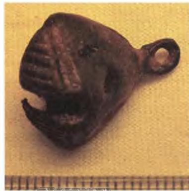
Мал. 14. Бронзавая бразготка з крыжападобнай проразцю.