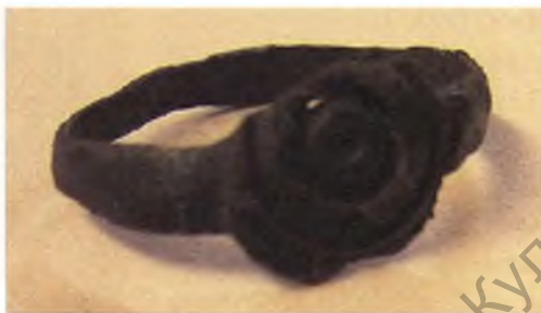
Мал. 16. Бронзавы пярсцёнак.

Гірка-разнавага з бронзы, якая мае вышыню 1,5 см, дыяметр сярэдзіннай часткі — 2,1 см, дыяметр верхняй часткі — 1,2 см.