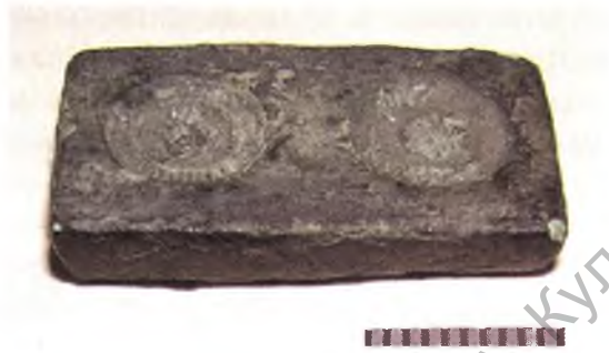
Мал. 18. Бронзавая ювелірная форма.

Зазначым і прысутнасць на вывучаемай тэрыторыі прадстаўнікоў элітнай рамеснай прафесіі — ювеліраў. У раскопах 2004 і 2006 гг. былі знойдзены артэфакты, якія сведчаць аб развіцці гэтай галіны рамяства (сценкі тыгляў, бронзавы злітак і нарыхтоўкі). У сёлетнім раскопе 1 знойдзена бронза- вая форма, якая, магчыма, прызначалася для адліўкі ўпрыгажэнняў, на- прыклад, паясных накладак (мал. 18). Форма мае невялікія памеры — 2,8x1,5x0,5 см. Знойдзена ў стратыграфічным пласце XI ст.