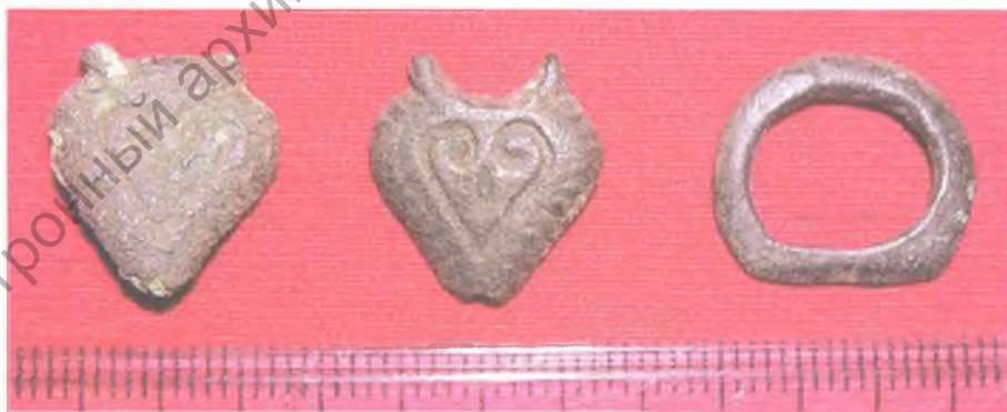
Мал. 7. Бронзавыя накладкі на скураны рамень і раменная спражка.

Дзве другія накладкі і спражка (мал. 7) таксама не маюць прамых аналогій. Аднак дэкаратыўны матыў «пальметаў» і тыпалагічная прыналежнасць накладак дазваляе суадносіць іх з храналагічнай групай вырабаў X–XII стст. [9, рис. 22: 33–34].