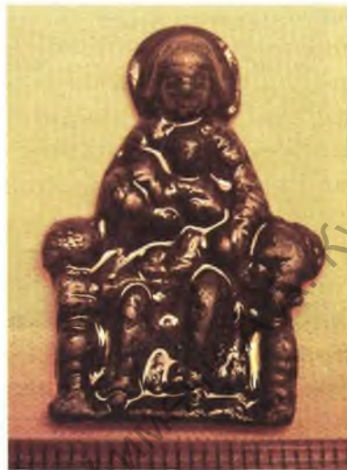
Мал. 9. Абразок-устаўка з выявай Божай Маці з Немаўлём.