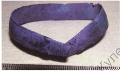
Мал. 11. Бронзавы бранзалет.

Бронзавы званочак-бразготка з крыжападобнай проразцю і арнаментаванымі пялёсткамі вышыняй 1,9 см (мал. 14).