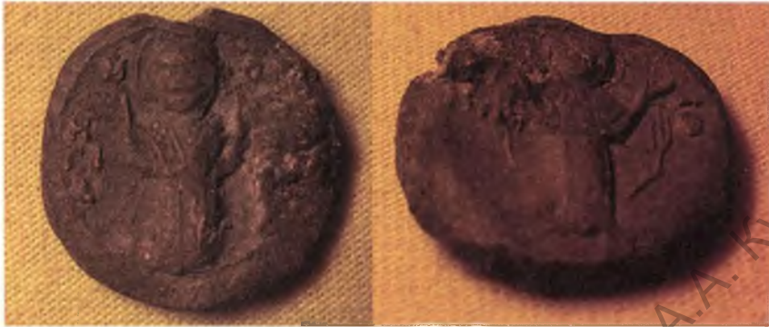
Мал. 2. Свінцовая епіскапская пячатка (пярэдні бок і адварот).

Такім чынам, стратыграфія раскопаў 2012 г. вельмі падобная на стратыграфію раскопаў 2004 і 2006 гг. (гэта ж пацвярджаюць і археалагічныя знаходкі з культурных пластоў). Адпаведна, пацверджана сінхроннасць існавання пасялення на ўсёй вызначанай плошчы.