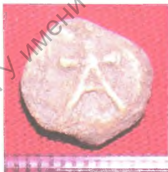
Мал. 4. Свінцовая пломба (пярэдні бок).

Бронзавая падвеска з княжацкім знакам знойдзена ў раскопе 4. Мае трапецыяпадобную форму, памеры — 4,4x2,8 см (мал. 5). Захаваліся слабыя сляды серабрэння паверхні. Падобныя падвескі выкарыстоўваліся прадстаўнікамі княжац-