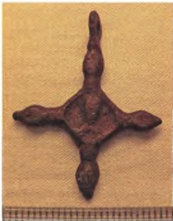
Мал. 8. Бронзавы нацельны крыжык.