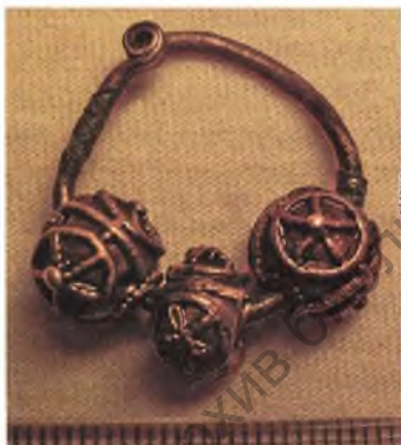
Мал. 10. Завушніца з бронзы і серабра.

З прадметаў хрысціянскага культу вылучаецца калекцыя нацельных крыжыкаў. Адзін з іх мае памеры 3,2x2,5 см. У рамбічным па форме сяродкрыжжы ў круглым медальёне змешчана выява святога (мал. 8). Падобныя крыжы тыпалагічна даюцца XI–XII стст. [2, с. 31, рис. 9: 25].