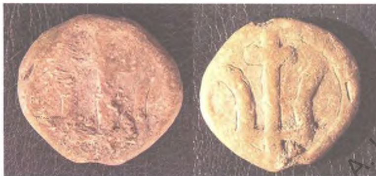
Мал. 3. Свінцовая печатка з выявай княжацкага знака (пярэдні і адваротны бакі).

мае дыяметр 2,3 см. На абодвух баках змешчана выява родавага княжацкага знака — трызубца з крыжом пасярэдзіне (мал. 3). Паводле С.В. Бялецкага, родавы знак трызубец з ускладненай формай вяршыні цэнтральнага зубца характэрны для малодшых дзяцей Уладзіміра Святаславіча — Ізяслава, Яраслава, Мсціслава і Судзіслава [4, с. 18].