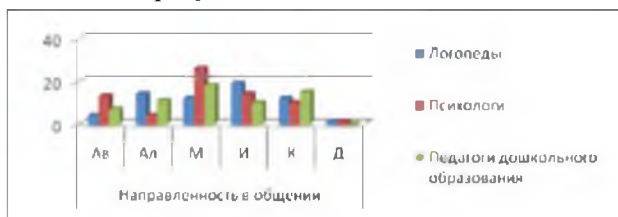
Рис. 1. Результаты диагностики коммуникативной направленности личности студентов с помощью методики НЛО:

Графически результаты исследования коммуникативной направленности личности студентов психолого-педагогических специальностей представлены на рисунке 1.