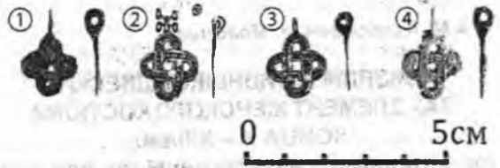
Рис. 1. Бизеллипсоидные привески из курганных могильников Могилёвского Поднепровья и Посожья. 1 – Ботвинювка, 2–3 – Чаусы, 4 – Восход