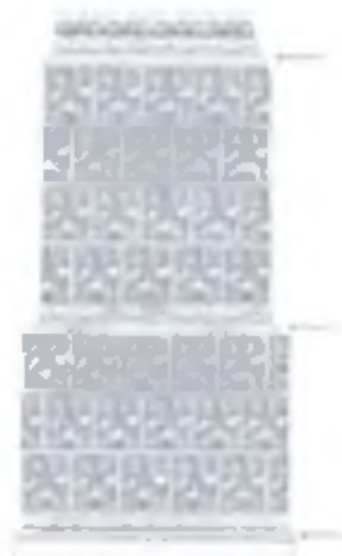
Печь с изразцами

Репрезентативная коллекция изразцов была получена в ходе археологических исследований Быховского замка в 2013 г. 1 [1, с. 27]. Хронологически по стилистике изображений и аналогиям, особенностям производства все найденные печные изразцы охватывают период с XVII до начала XX в. [1, с. 27-30]. По статистическим подсчетам изразцы XVII – XVIII вв. составляют 96,5 % (551 фрагмент) коллекции, изразцы XIX – начала XX в. – 3,5% (21 фрагмент) 2 .