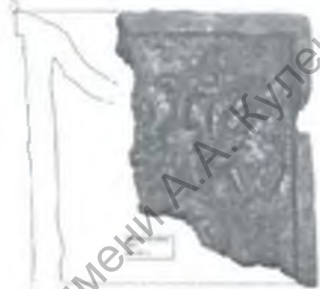
Рис. 3 Изразец с латинской буквой «W»

Изразцы с изображением «букета в вазе» не относим к растительным, поскольку они получили широкое распространение и часто описываются исследователями как отдельная орнаментальная категория. Таких изразцов в коллекции более 280 фрагментов. Условно можно выделить два варианта изразцов в данном сюжете [2, с 60-62]. К первому относятся изразцы с изображением «букета в вазе» с птицами по бокам. Это изображение можно отнести также к распространенному сюжету «дерева жизни». Высота лицевой пластины и румпы зеленополивных изразцов составляет около 7,91 см, для терракотовых – 6,2-6,5 см. Второй вариант представлен «букетом в вазе», вписанным в арку. Выделяются два подварианта, которые отличаются видом арки и букета (инд №1271, 17а). Изразцы с «букетом в вазе» имеют одноступенчатую рамку по краю пластины шириной 0,6-0,7 см, высотой 0,3-0,5 см. Излом черепка у зеленополивных изразцов – темнее к поливе, у терракотовых – трехслойный или однослойный. По следам на терракотовых изразцах можно говорить об их изготовлении из деревянной матрицы. На терракотовых фрагментах встречаются затеки зеленой поливы, что говорит об обжиге в одном горне с зеленополивными изразцами.