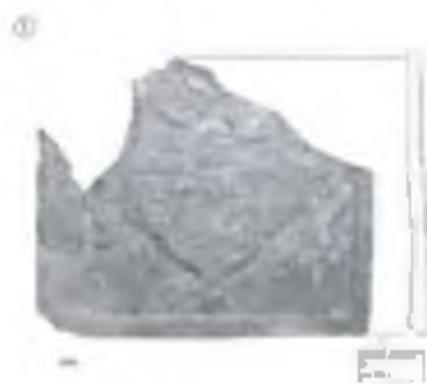
Рис. 2 Зеленополированный геральдический изразец с изображением герба Яна Станислава Сапег

Геральдические стенные изразцы представлены в коллекции с изображением гербов, латинских букв, букв и цифр, штифодержателей. Они представлены терракотовыми, зеленополированными и полихромными экземплярами (Рис. 2).