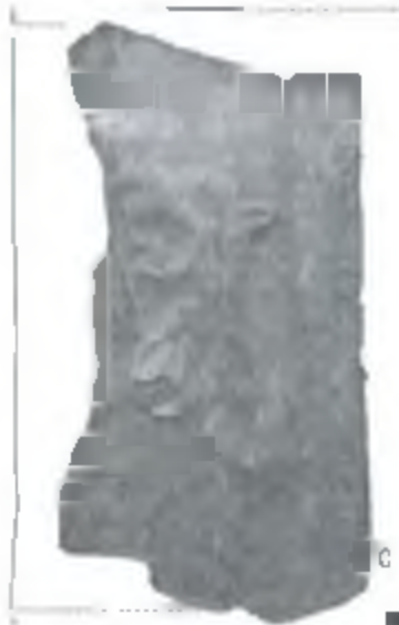
Рис. 4 Итрацц с изображением «букет»

На ряде артефактов сохранились фрагменты выходящих веток, цветов, гроздей винограда или змея (инд №1247,1041,1325,319,1243,458,509). Полный сюжет лицевой пластины восстановить не удается, поэтому фрагменты итраццо с такими изображениями трудно отнести к какой-либо конкретной категории сюжета. Нами они определяются как фрагменты итраццо с сохранившимися растительными элементами. Итраццо коллекции с такими элементами зеленочерные и терракотовые, высота рельефа на изделках варьируется от 0,1 см до 0,4 см, у некоторых сохранилась одноступенчатая рамка. Толщина лицевой пластины от 0,8 см до 1 см, черепок на изломе плотный.