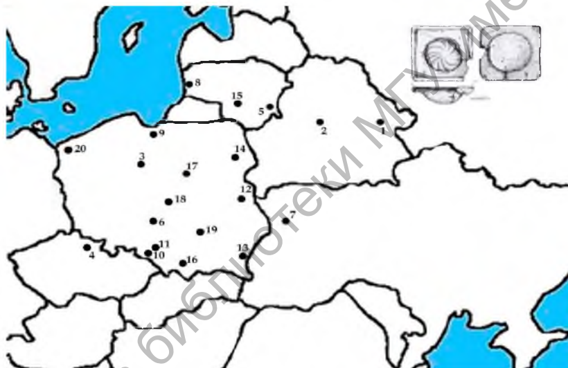
Рис. 2. 1 – Славгород; 2 – Заславь; 3 – замок в Расянюкку; 4 – Рожнув; 5 – Вильнюс; 6 – Петрыкув-Трыбунальский; 7 – Луцк; 8 – Клайпеда; 9 – Мальборк; 10 – замок в Рацибуже; 11 – замок в Худове; 12 – Люблин; 13 – Пшемьсль; 14 – Белосток; 15 – Каунас; 16 – Спытковице; 17 – Цеханув; 18 – Иновлодзь; 19 – Пиньчув; 20 – Старгард

Карта распространения сюжета (рис. 2) указывает на широкое использование его на территории Королевства Польского с отсылкой на немецкую традицию, и в меньшей мере на территории ВКЛ. В хронологическом плане сюжет используется в конце XV – XVI в. Таким образом, славгородский изразец с «солярным» изображением отражает общие культурные тенденции изразцового дела ВКЛ и Королевства Польского.