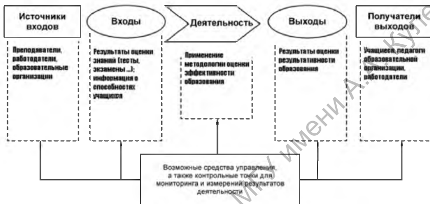
Схематическое представление элементов отдельного процесса (оценки результата образовательного процесса)

Он фокусируется на системах управления образовательных организаций, а также воздействии их на обучающихся и других соответствующих заинтересованных сторонах. Стандарт провозглашает процессный подход и мышление на основе рисков, а также цикл PDCA (Планируй-Делай-Проверяй-Действуй), который может быть применен ко всем процессам и системе управления в целом (рис. 1–2).