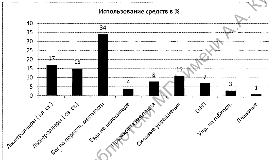
Рис. 1. Средства ОФП и СФП, используемые в тренировочном процессе лыжников-гонщиков

На основании анализа тренировочных планов было установлено, что подготовительный период у лыжников-гонщиков начинается с мая и заканчивается в середине октября. Все это время спортсмены тренируются в бесснежных условиях. Анализ тренировочного процесса по спортивным дневникам и проведенному анкетированию показал, что основная часть тренировочной нагрузки в подготовительном периоде приходится на использование однообразного спектра средств ОФП и СФП. Это стандартный набор тренировочных средств лыжника-гонщика: бег на лыжероллерах свободными и классическими ходами, бег по пересеченной местности, бег с прыжковой имитацией в подъем, езда на велосипеде, силовые упражнения, упражнения на растягивания и ОФП используемые в разминке и заминке. В целом весь спектр упражнений можно увидеть на рисунке 1.