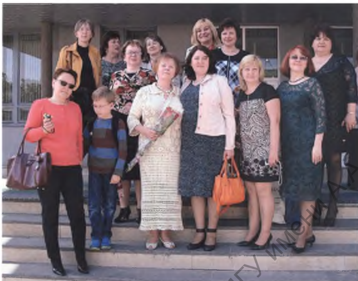
Встреча с выпускниками факультета дошкольного воспитания: «30 лет спустя» – в МГУ имени А.А. Кулешова (2014 г.)