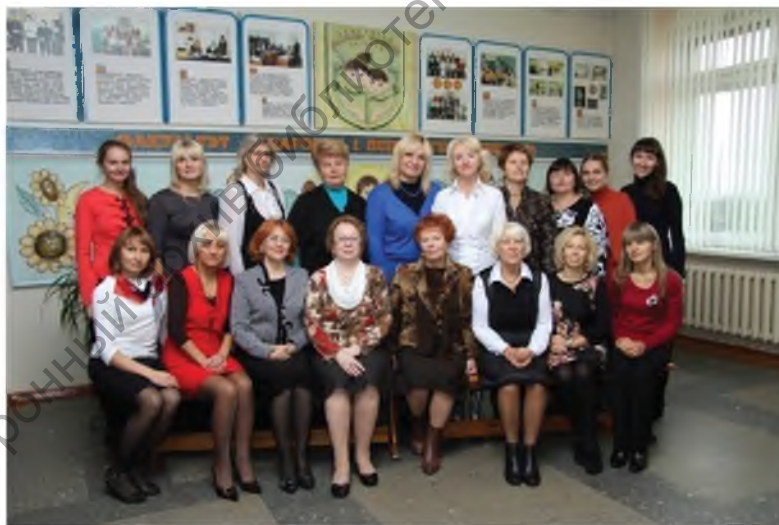
Профессорско-преподавательский состав кафедры педагогике детства и семьи в 2013 году