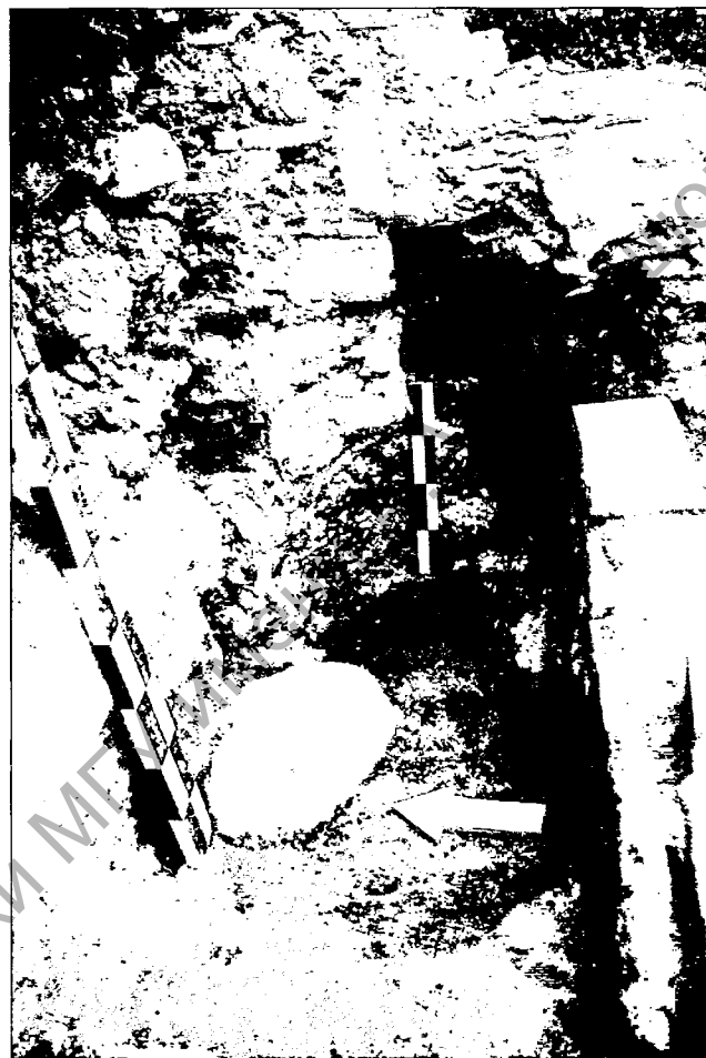
Аркасольная ніша ў паўднёвай сцяне, заходняя сценка, від з усходу і захаду.

Спаса-Праабра- жэнскі храм Спаса- Еўфрасіннеўскага манастыра. План- рэканструкцыя храма XII ст. (варыянт 2017 г.)