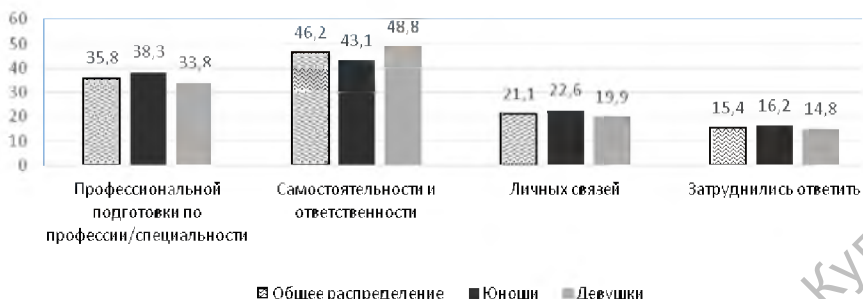
Рис. 1. Распределение ответов на вопрос: «Чего, по вашему мнению, не хватает молодым людям для начала самостоятельной трудовой жизни?», %

В первую очередь молодые люди указывают на недостаточность самостоятельности и ответственности. В настоящее время много говорится о социальной пассивности молодежи, исследователи называют данное явление социальным инфантилизмом, когда человек не желает принимать на себя новые обязанности и обязательства в связи со взрослением, что считается результатом нарушений в процессе социализации. Это выражается в неосознанности значимости удовлетворения разного рода потребностей через трудовую деятельность в том числе и для личного благополучия. Возможно, по этой же причине мы можем наблюдать достаточно большое количество затруднившихся ответить на этот актуальный для молодежи вопрос. Примерно треть указывает на проблемы с профессиональной подготовкой, т.е. молодежь ощущает недостаток знаний, навыков, компетенций после учебных заведений, требуемых для начала самостоятельной работы. Не утрачивают своей значимости и личные связи, т.е. идет не только конкуренция за счет способностей и трудолюбия, но и применяются так называемые каналы неинституциональной мобильности, т.е. трудоустройство через родственников, знакомых. Результаты показывают почти полное отсутствие различий в ответах юношей и девушек, хотя, как известно, специфика гендерной социализации может сказываться на шансах на рынке труда, а также на представлениях и установках в отношении трудовой деятельности.