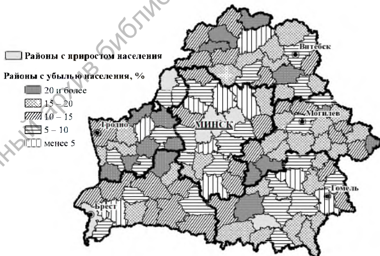
Рис. 3. Динамика численности населения районов за 2009–2017 гг.

На уровне административно-территориальных единиц 2-го уровня (118 районов и 10 городов областного подчинения) лишь в 16 административных субъектах численность населения выросла за 2009–2017 гг. В их числе все 10 городов областного подчинения и 6 районов. Наибольший прирост отмечен в Минском районе – более чем на 1/3, а также в городах областного подчинения Гродно, Бресте и Гомеле – 15,3 %, 13,9 % и 10,1 % соответственно. В число районов с приростом населения входят Брестский, Дзержинский, Мозырский, Островецкий и Смолевичский. С другой стороны, в 48 районах численность населения за данный период сократилась более чем на 15 %, а в 16 убыль превысила 20 %. Около \frac{1}{4} всего населения потеряли Барановичский район Брестской области, Зельвенский и Свислочский районы Гродненской области (рисунок 3).