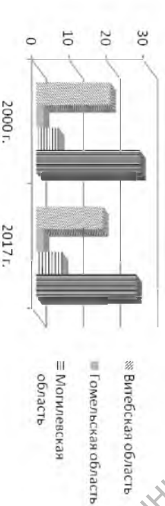
Диаграмма 1. Общины старообрядчества в восточной Беларуси в 2000 и 2017 гг.