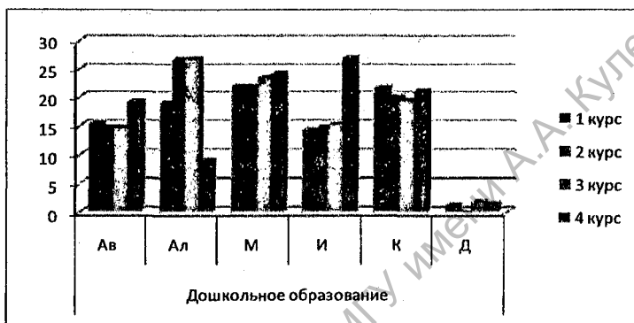
Рис. 2. Динамики коммуникативной направленности студентов первого-четвертого курсов, обучающихся по специальности «Дошкольное образование»:

Динамика коммуникативной направленности личности в общении будущих педагогов дошкольного образования в процессе обучения графически представлена на рисунке 2.